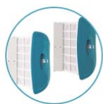
2 pojedyncze wkłady z mikrofibry