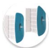
Podwójny wymienny filtr 4D:

filtr składa się z dwóch oddzielnych wkładów z mikrofibry