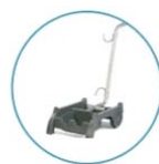
Wózek do transportu i przechowywania odkurzacza