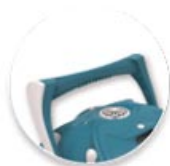
Funkcjonalny uchwyt: ustawianie trajektorii ruchu

filtr składa się z dwóch oddzielnych wkładów z mikrofibry